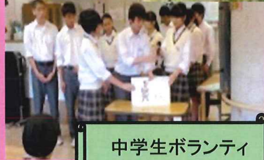
中学生ボランティア