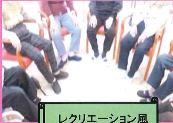
レクリエーション風