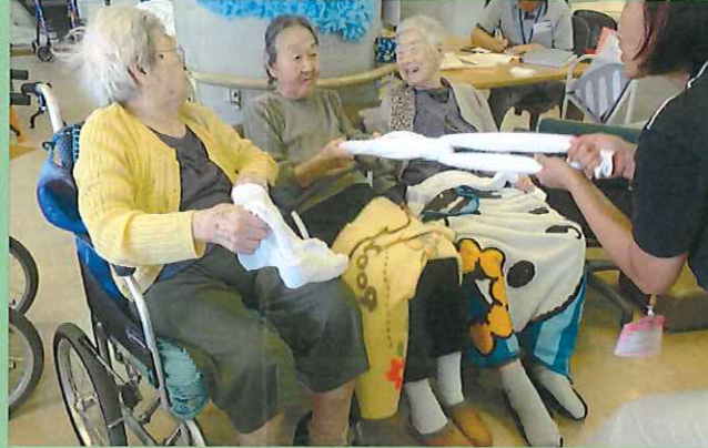
レクリエーション風景